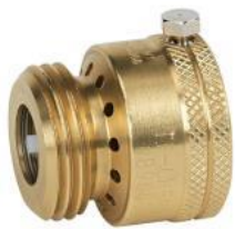
バキュームブレーカー

公共飲料水システムと品質が疑わしい別ソースとの接続は、クロスコネクションと見なされることをご存知ですか？ たとえば、バケツの水、車のラジエーター、またはプールに沈められた通常のガーデンホースは、逆流汚染を引き起こす可能性があります。配水を汚染から保護するために、ガーデンホースを使用する場合は、常に簡単なねじ込み式のバキュームブレーカーを蛇口に取り付ける必要があります。