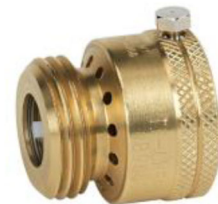
バキュームブレーカー

たとえば、バケツの水、車のラジエーター、またはプールに洗められたガーデンホースは、逆流汚染を引き起こす可能性があります。私たちの給水を保護するために、ガーデンホースを使用するときは、常に簡単なねじ込み式バキュームブレーカーを蛇口にに取り付ける必要があります。