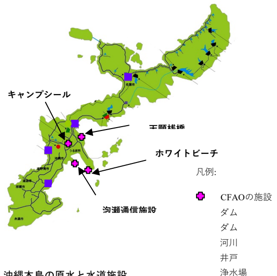
図 1 沖縄本島の原水と水道施設

CFAO 施設での水道水は、日本環境管理基準 (JEGS) 及び米国第 1 種飲料水規則 (NPDWR) の基準を満たさなければなりません。この JEGS は、国防総省の自律的な基準であり、日本国内の国防総省所属部隊及び施設が人々の健康及び自然環境を守ることを目的としています。また、米海軍は 2013 年より合衆国本国との水質基準に合わせる